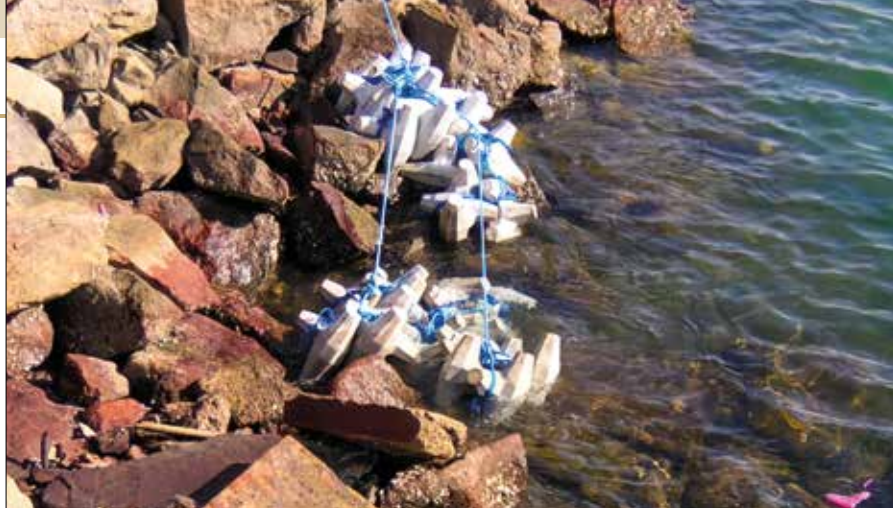
Quebra-mares com uso de escórias de alto-forno desenvolvido na UFES