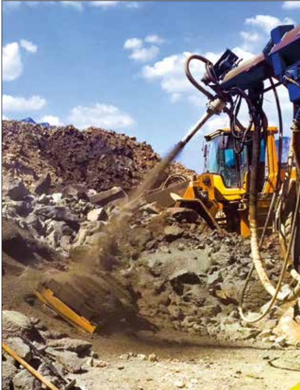
Pesquisas em concreto projetado realizadas na Graz University of Technology.

duas mulheres num grupo de quarenta na turma em que me formei, em 1988. Esta desigualdade se manteve quando fui exercer engenharia, quando fiz pós-graduação e quando me tornei professora, com 24 anos, na UFES. Em 2000, fui eleita a primeira diretora do Centro Tecnológico da UFES, que congrega os cursos de Engenharia e ciência da computação, cargo que exerci até 2008, em dois mandatos. Até hoje, nenhuma outra mulher foi eleita para esta função, o que reforça que ainda temos um longo caminho a trilhar para aumentar nossa