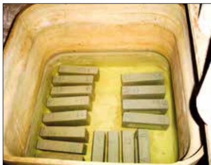
Processo de produção de tijolo com resíduos de siderurgia para habitação de interesse social