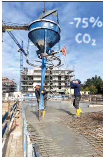
FIGURA 3 APLICAÇÃO EFC EM 4HÖFE

compatível com o uso em infraestrutura, incluindo exigências de desempenho mecânico, durabilidade e controle de produção (DIBt, 2024a).