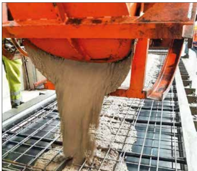
FIGURA 5 APLICAÇÃO EFC EM PRÉ-FABRICADO

fundações e paredes estruturais, totalizando aproximadamente 3.000 m 3 de concreto. A adoção do EFC permitiu uma redução estimada de cerca de 600 toneladas de CO 2 , mantendo os requisitos estruturais