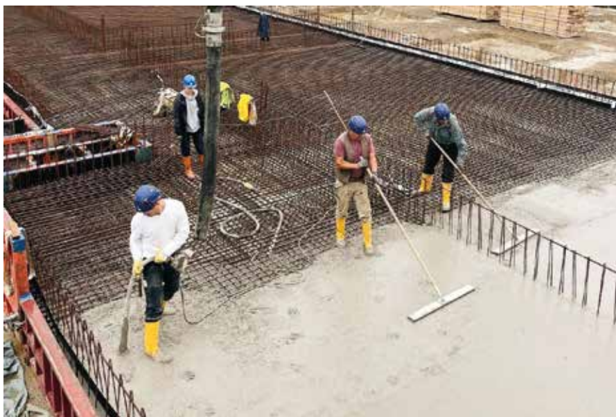
FIGURA 4 APLICAÇÃO EFC EM 4HÖFE