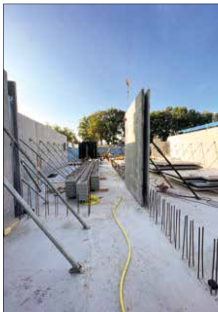
FIGURA 6 INSTALAÇÃO DE PEÇAS PRÉ-FABRICADAS

fundações e paredes estruturais, totalizando aproximadamente 3.000 m 3 de concreto. A adoção do EFC permitiu uma redução estimada de cerca de 600 toneladas de CO 2 , mantendo os requisitos estruturais