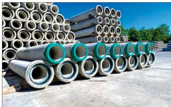
FIGURA 7 TUBOS EM EFC NA NEXT-BETON

Embora ensaios convencionais de consistência, resistência mecânica e durabilidade permaneçam aplicáveis, a interpretação