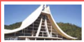
Protensão aderente e não-aderente