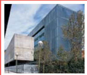
Edifício da Empresa Municipal de Transportes