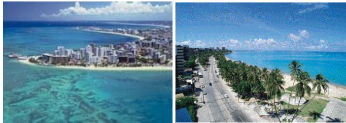
Maceió, Brazil, October 09 -10, 2012

VENUE: Convention Center of Maceió Cultural and Exhibition Center Ruth Cardoso Rua Celso Piatti, s/n - Jaraguá – Maceió – Alagoas - Brazil