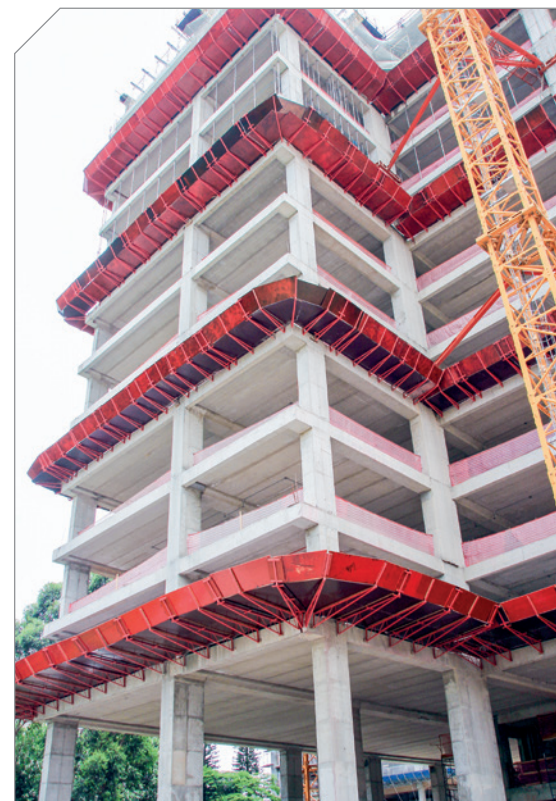
Vista de parte da estrutura de uma das torres do complexo Parque da Cidade, em São Paulo

elementos para o programa. Os três programas em uso hoje – CYPECAD, TQS e EBERICK – partem de uma entrada tridimensional, sendo parte da tecnologia BIM. Neles, é possível ver a estrutura em 3D, fazer cortes em 3D, exportar arquivos no padrão universal de interoperabilidade entre programas BIM. Estes programas também fazem a documentação das formas em 2D e os desenhos das armações. Para funcionar bem, todas as equipes precisam trabalhar com BIM desde o começo do projeto e as decisões devem ser tomadas cedo.