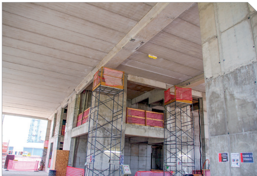
Detalhes de elementos construtivos de um dos pisos de uma edificação

R. F. – Os edifícios altos ajudaram a desenvolver a engenharia, porque exigem novas tecnologias de concreto e de projeto, como considerações de retração e fluência do concreto, que levam a encurtamentos diferenciados dos pilares conforme a construção evolui, encurtamentos que precisam ser compensados durante a construção. Nos edifícios de mais de 250 metros, é preciso lançar mão de tipologias que não consistem apenas de pórticos e pilares-parede, como os outriggers , peças que ligam o núcleo do prédio à periferia para resistir a esforços horizontais e que ficam