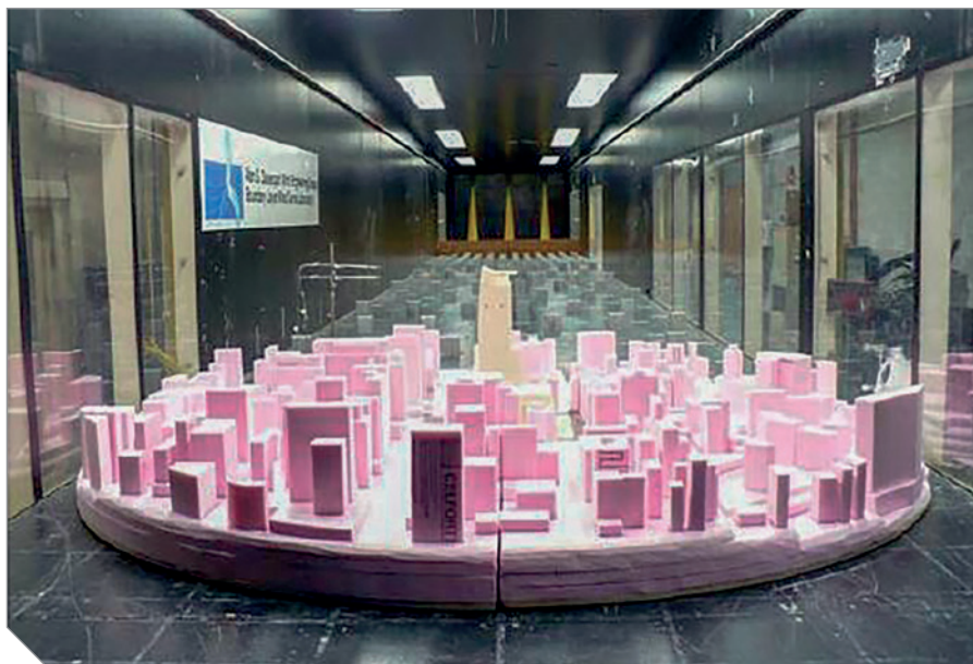
Ensaio de túnel de vento, realizado no The Boundary Layer Wind Tunnel Laboratory (Canadá) para o projeto da Torre Paulista

R. F. – Embora trabalhe com o projeto de edifícios altos no Brasil, que vão até 220 metros, considero um contrassenso edifícios com mais de 250 metros, que servem como ícones, para marcarem presença no mundo. Na China, foi tomada recentemente uma decisão para não permitir edifícios com mais de 500 metros e edifícios com mais de 250 metros precisam ser justificados. Eu vi isto num vídeo da B1M no YouTube, que mostra uma tendência por edifícios mais baixos, mais funcionais e mais integrados à paisagem urbana. Com a Covid-19 e suas decorrências, é possível que a tendência daqui para frente seja edifícios abaixo de 250 metros. Do ponto de vista de custo da estrutura, ele começa a se elevar de uma maneira desproporcional acima dos 120 metros ou 140 metros, a depender da eficiência estrutural, o que depende da tipologia do apartamento ou escritório. Um edifício muito alongado tem baixa eficiência