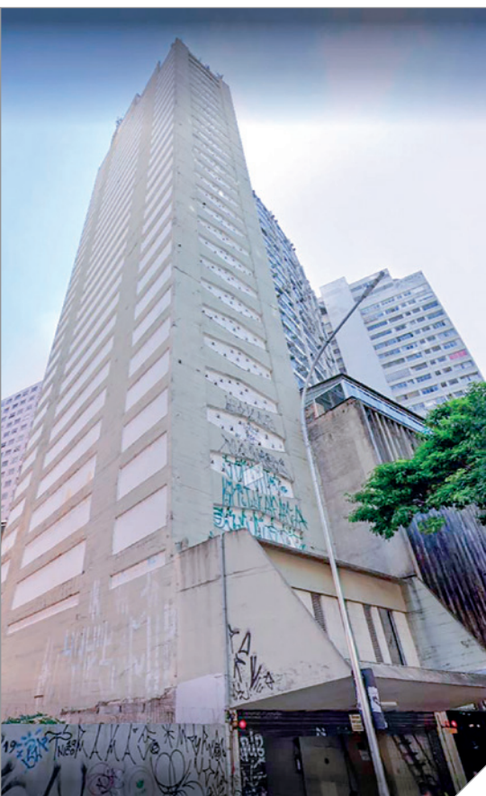
Vista do Edifício Garagem San Siro, em São Paulo

forças horizontais numa edificação são de dois tipos: o vento, que claramente empurra o prédio lateralmente; e o desaprumo da estrutura, que faz com que as cargas verticais não sigam a trajetória segura das vigas para os pilares e desses para as fundações, provocando a perda de verticalidade dos esforços, o que causa instabilidade no prédio, tecnicamente chamados de esforços de segunda ordem. Dessa forma,